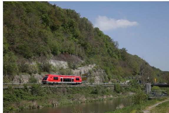
Links: Baureihe 644, rechts: Baureihe 641.