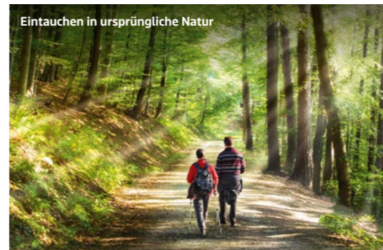
Eintauchen in ursprüngliche Natur