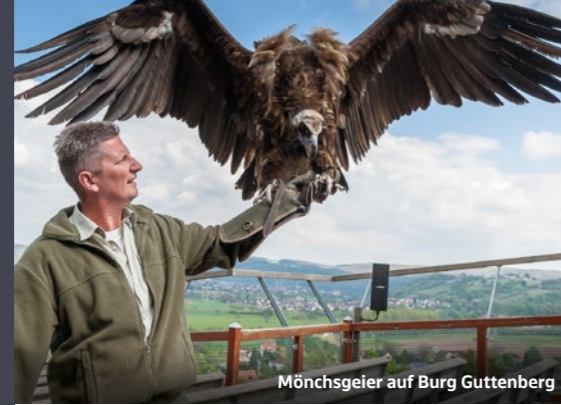
Mönchsgeier auf Burg Guttenberg