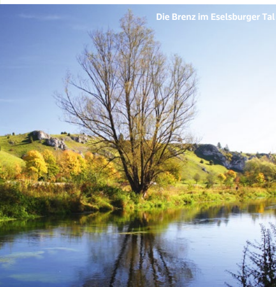
Die Brenz im Eselsburger Tal

*Umstieg am Bahnsteig gegenüber. Verkehrt sonn- und feiertags vom 05.05. bis 20.10.2024, jedoch nicht an den Fahrtagen des Dampfzugs am 09.05., 14.07., 09.09. und 06.10.2024 (Infos unter alb-bahn.com oder Tel. 0800 4447673). uef-dampf.de