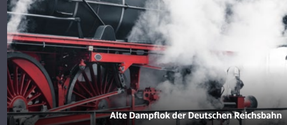
Alte Dampflok der Deutschen Reichsbahn